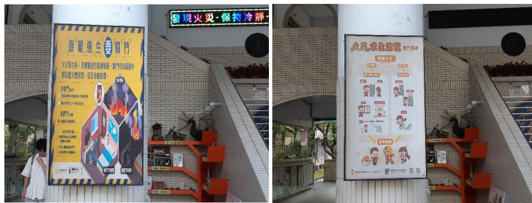
於學校川堂電子海報機宣導避難逃生門、火災求生流程