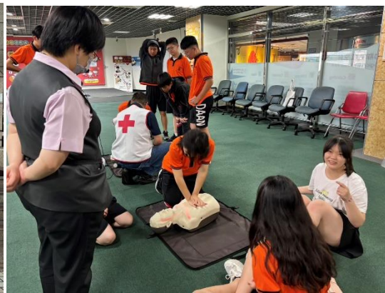
運用社團活動課，帶領學生到臺北市防災科學教育館參觀