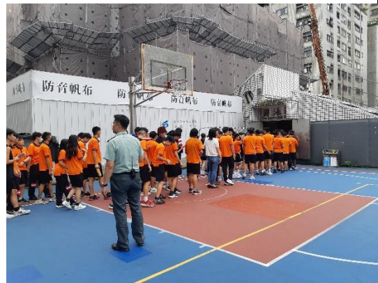
辦理113年度萬安47號演習防空疏散避難演練預演